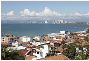
Alistan construcción de megaproyecto turístico