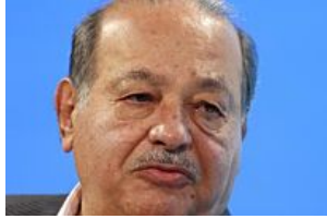
Vuelve la época de bonanza para las empresas de Slim