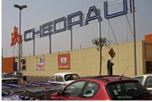
Chedraui, con ganas de salir de compras en México