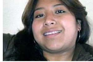
Encuentran muerta a universitaria