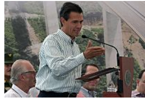
Propone Senado tema de EPN de consulta popular