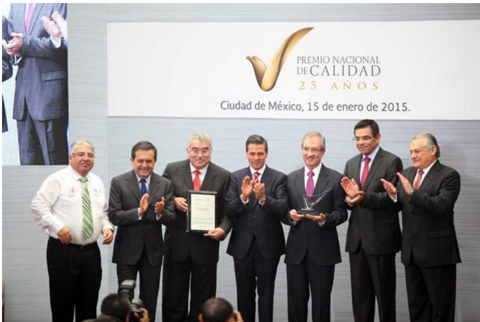
El presidente Enrique Peña Nieto con representantes de empresas acreedoras al galardón de calidad.

Con la inserción de las empresas mexicanas en las cadenas globales de valor, nuestro país tiene un papel privilegiado ante el mundo, el cual cada vez más reconoce la calidad de nuestros productos, por lo que la expresión "Hecho en México" es sinónimo de excelencia, afirmó el presidente Enrique Peña Nieto.