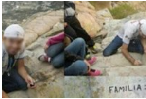
Familia raya una de las caras de la Peña de Bernal